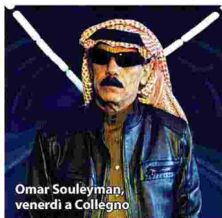
Omar Souleyman, venerdì a Collegno

e surrealismo di stampo kraut-rock dei Planet Opal e la voce di Altea dei Thru Collected, al suo debutto solista.